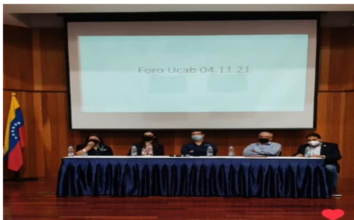
Ponentes del Foro

También es cierto que esto con el tiempo ha ido cambiando y ha cambiado hasta tal punto que para nadie es secreto los indicadores que hoy en día tenemos en el país, que hace que sea sumamente complicado hacer negocios en el país, mantener el desarrollo sustentable -una tarea súper compleja- sabemos que prácticamente en los últimos 8 o 10 años se ha producido una economía en tres cuartas partes, es decir, hoy somos el 20% de lo que éramos hace casi una década. Esto es parte de lo que tratamos en el foro, en este espacio de construcción de ideas y propuestas.