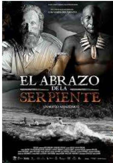
Figura 3. Afiche. Tomado de la web