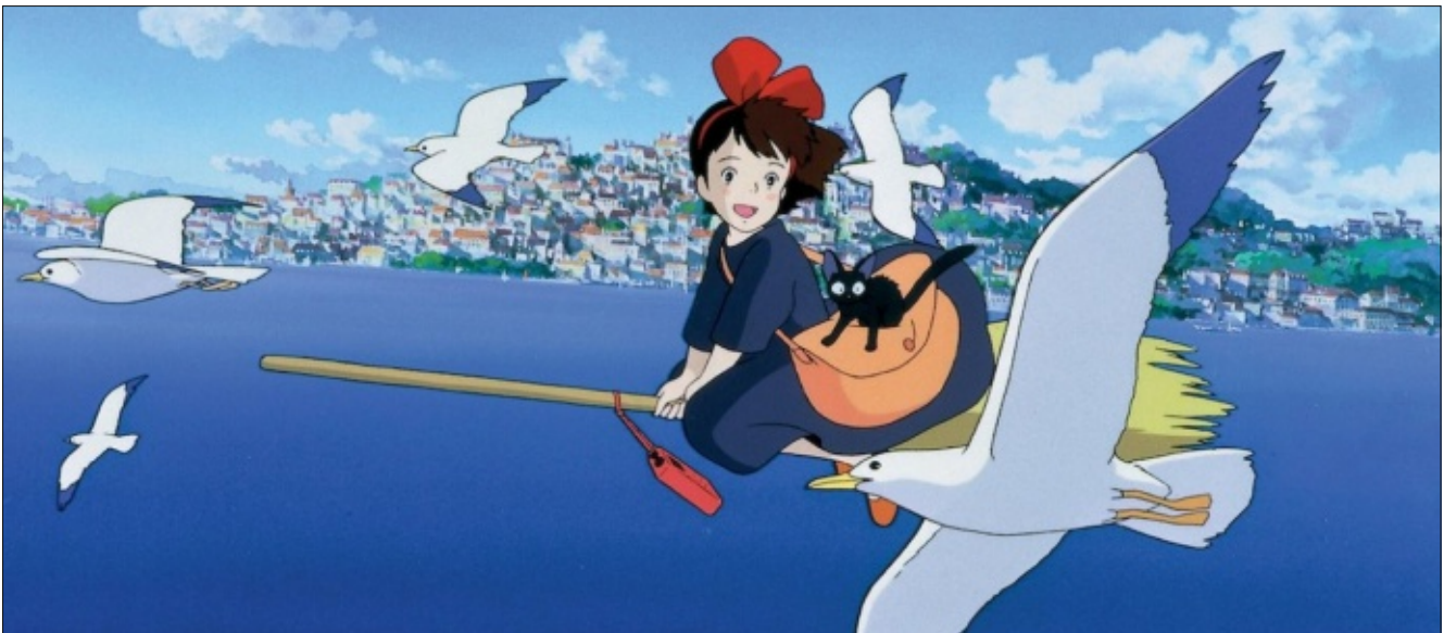
Nicky, la aprendiz de bruja (1989) de Hayao Miyazaki.

Kiki atrae a los humanos por su sencillez y sinceridad. La señora Osono entra en su vida por un favor recibido, la diseñadora agradece su disposición por entregar un regalo y la abuela de la casa grande la quiere por cada acto generoso con ella (preparación del pastel de pescado y su entrega, el cambio de bombillo).