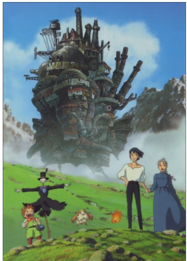
El castillo ambulante (2004) de Hayao Miyazaki.

La familia se funda en la adopción, enmarcada en la idea de «pensar con» y «actuar con». No se piensa en los otros, se incluye a «nosotros» en cada una de las decisiones tomadas. Cada miembro se siente como parte de una manada.