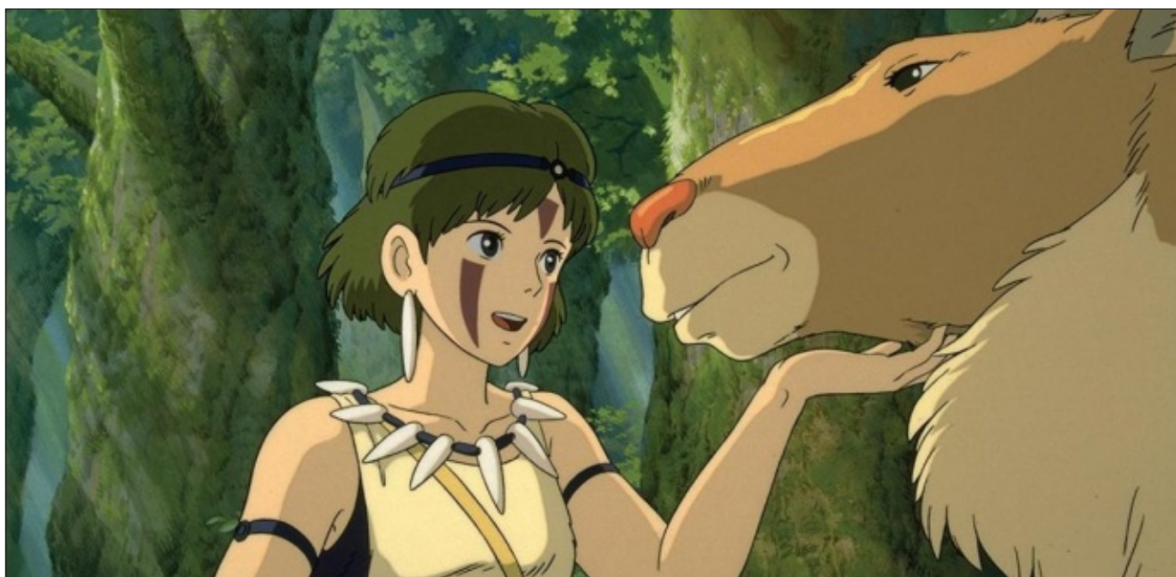
La princesa Mononoke (1997) de Hayao Miyazaki.

A continuación se desarrollan más extensamente.