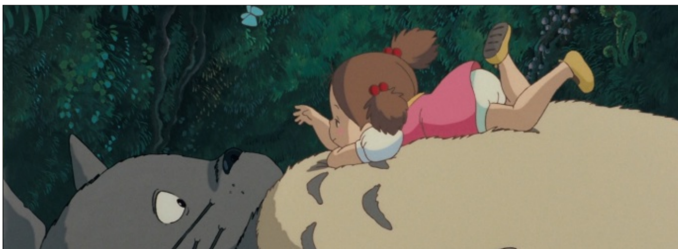
Mi vecino Totoro (1988) de Hayao Miyazaki.

Miyazaki, H. (Director). (2013). El viento se levanta [Película]. Studio Ghibli.