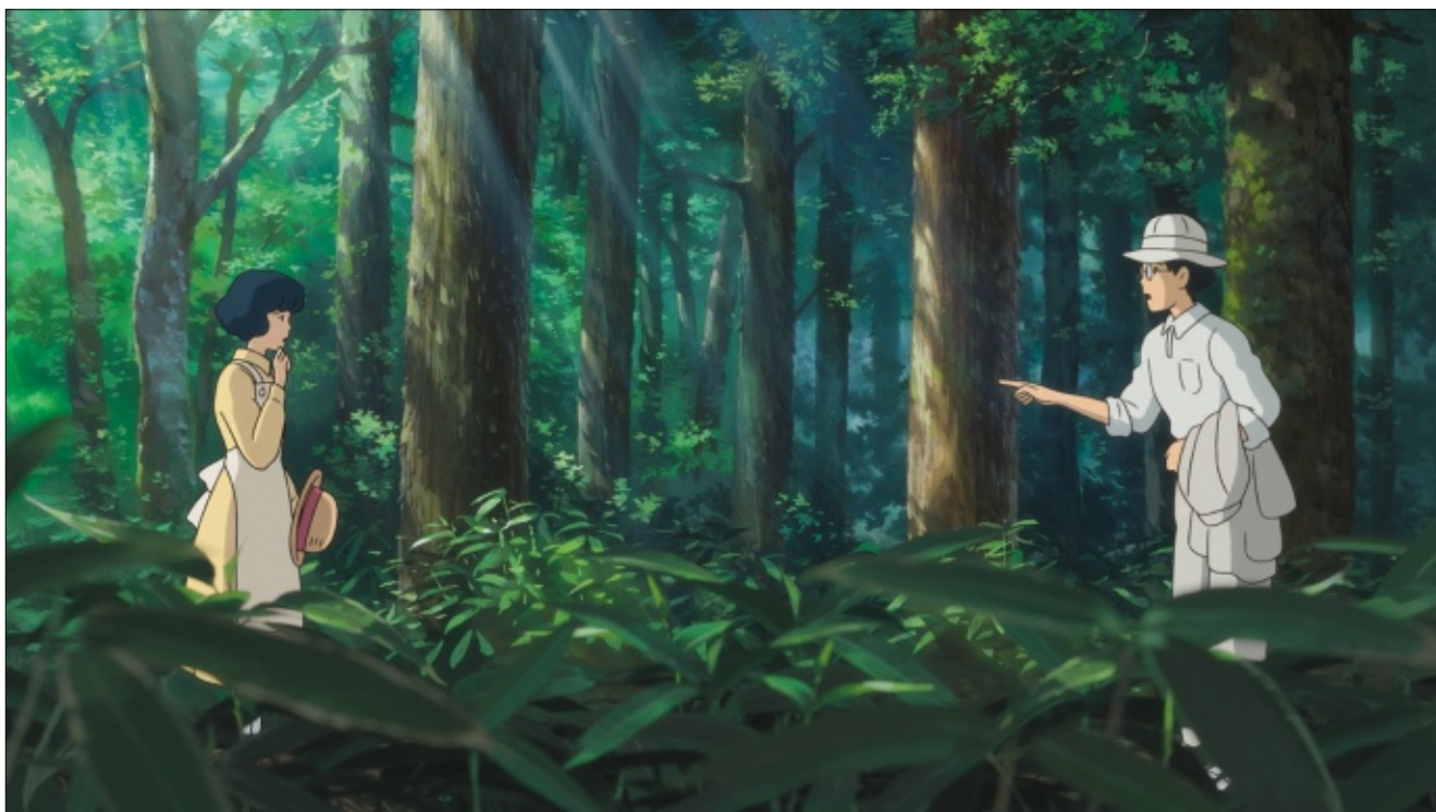
El viento se levanta (2013) de Hayao Miyazaki.

Varias escenas muestran los kodama (espíritus de los árboles). Lucen con un pequeño cuerpo humano y con una cabeza rotatoria. Son juguetones y nobles. Guían al príncipe Ashitaka por el bosque. Para el príncipe representa: « el bosque está sano ».