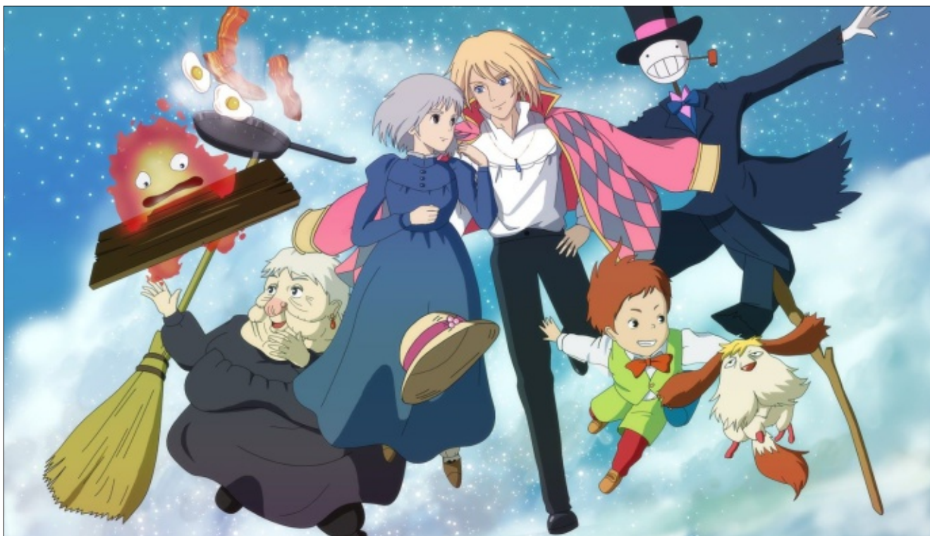
El castillo ambulante (2004) de Hayao Miyazaki.

Aquella pequeña bruja, aún con sus imperfecciones, sirve a los demás (animales y humanos). Su convivencia se fortalece al encaminar sus talentos (saber volar). A través del trabajo se relaciona de manera justa y amable con su entorno.