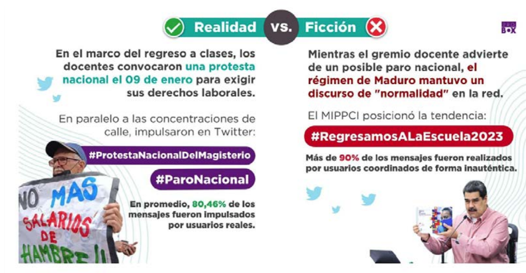
FIGURA 2. REGRESO A CLASES DESDE LOS GREMIOS Y LA VISIÓN OFICIALISTA.

Esta imagen de progreso y desarrollo se evidenció en el marco de la Serie del Caribe de este año 2023. Venezuela, siendo sede, estrena-