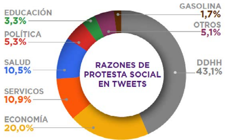
FIGURA 1. RAZONES DE PROTESTA SOCIAL EN TUI TS

ticos. Educación , veinte tendencias (3,3 % de la conversación digital) vinculadas con el sistema educativo en el país. Gasolina , once etiquetas y más de 33 mil mensajes sobre la escasez de combustible. Otros , diecisiete tendencias de protestas y 105 mil 051 tuits vinculados con temas diversos (ver figura 1).